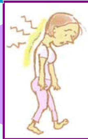
肩こりなど筋肉痛